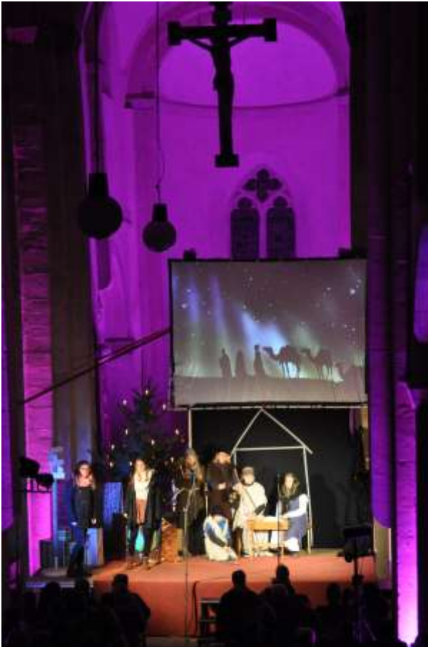
Bild links: Heiligabend in der Ulrichkirche

Titelbild: Heiligabend in Ederleben.