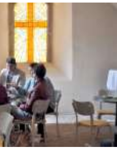
Kaffee kochen, Kuchen backen, abwaschen