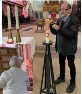
Lieder anstecken, Kerzen anzünden, Mikrofone einstellen, Kollekte zählen