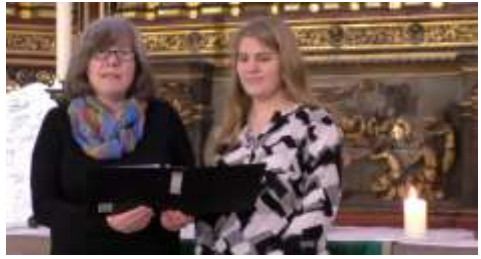
Gottesdienste halten, lesen, Gottesdienste mitgestalten, tanzen