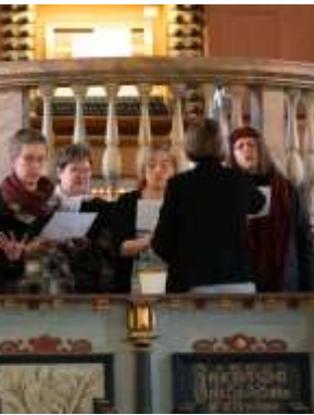
Musik machen, Violine & Flöte spielen, singen, im Posaunenchor blasen, registrieren, Noten ordnen, Eintrittskarten verkaufen