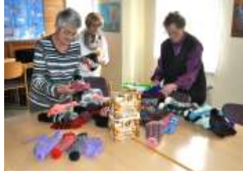
Lugala, Tüten kleben, Weihnachten im Schuhkarton