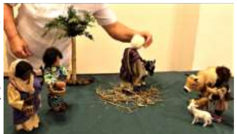
Kindergottes- dienst, Religiöse Kinderwoche, Puppenspiel, Familien- gottesdienst