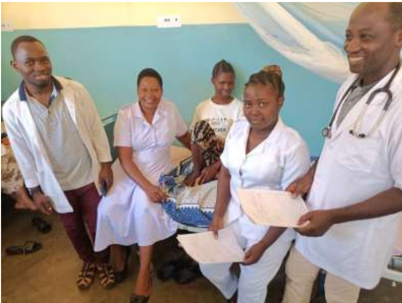
Die Kollekte bei der Musik im Kerzenschein am 3. Advent ist traditionell für das Lugala-Hospital bestimmt.