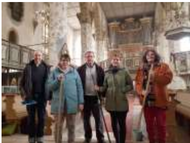
Kirchenputz, Kirchhof pflegen, reparieren, Rasen mähen, sich um Handwerker kümmern